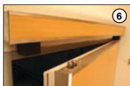
Horní hrana dveří s nerezovou lištou