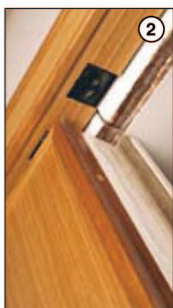
Detail dveří v provedení dýha