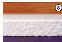
Zvuková a tepelná izolace