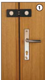
Hlavní a rozvorový zámek