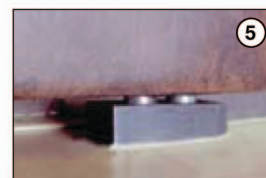
Spodní pouzdro zamykacích čepů